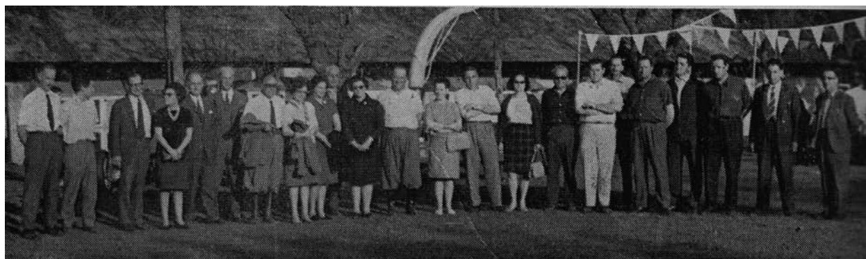
Los criadores de Merilín concurrentes a la 1º Feria de Vientres (1967)

reford, 27 Shorthorn y 3 Normando), 670 carneros (585 Corriedale y 85 Merilín) y 30 borregos Corriedale. El orden de venta era: lunes 2, reproductores bovinos; martes 3, reproductores ovinos (en cuyo marco se hizo la subasta de la 1º Feria de Vientres Merilín) y el miércoles 4 de octubre la Feria General, con una inscripción de 1.100 lanares y 800 vacunos, aunque la misma se limitó casi a la venta de lanares, destacándose los capones gordos, únicos con los que se hacía el abasto de Trinidad, pues el Poder Ejecutivo había prohibido hasta el 31/10/1967 la faena y venta de carne de vacunos.